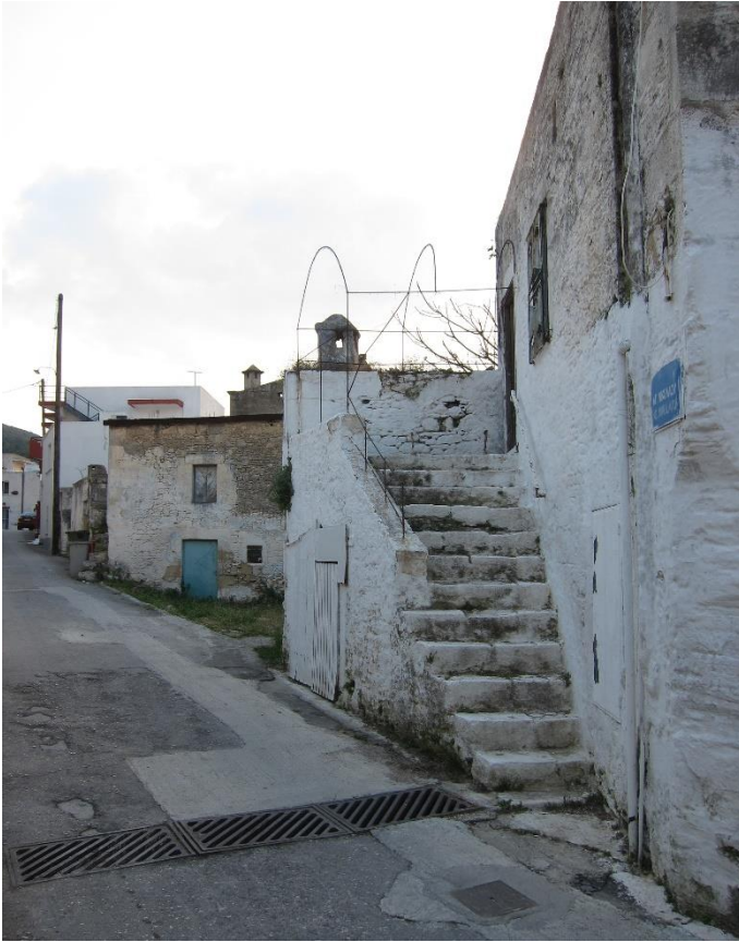
Εικόνα 3. Τα προς κατεδάφιση κτίσματα επί της οδού που οδηγεί από τον κύριο οδικό άξονα στην εκκλησία του Αγ. Νικολάου.