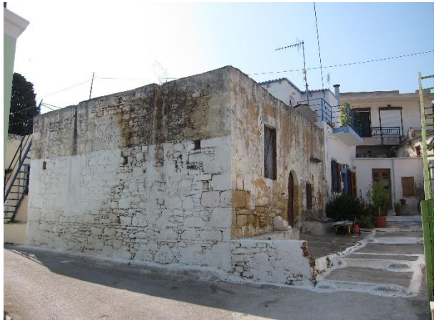
Εικόνα 17. Κτίσμα στον παλαιό πυρήνα του Παραδεισίου.