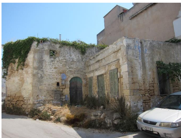
Εικόνα 13. Κτίσμα στον παλαιό πυρήνα του Παραδεισίου.