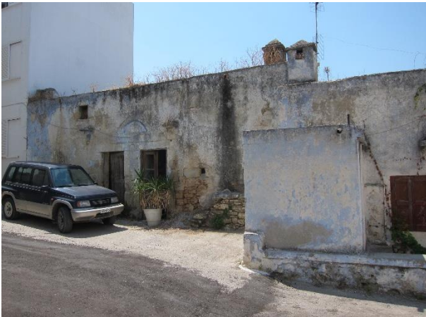
Εικόνα 16. Κτίσμα στον παλαιό πυρήνα του Παραδεισίου.