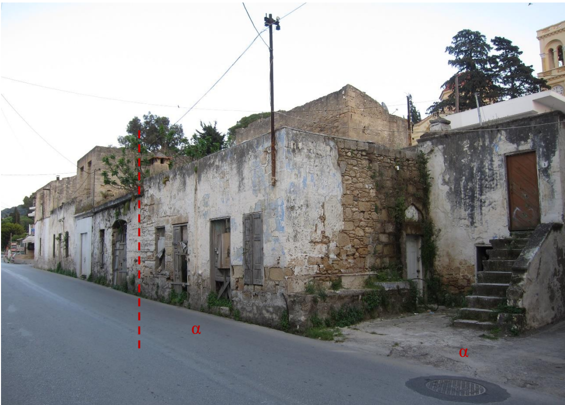
Εικόνα 2. Το προς κατεδάφιση οικοδομικό τετράγωνο από τα δυτικά. Με το γράμμα α. σημειώνεται το προς διατήρηση κτίσμα, το οποίο αποτέλεσε την οικία του Παπαλουκά. Με κόκκινη γραμμή σημειώνεται το όριο της κατεδάφισης.