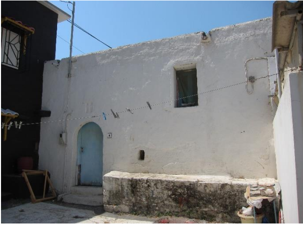
Εικόνα 14. Κτίσμα στον παλαιό πυρήνα του Παραδεισίου.