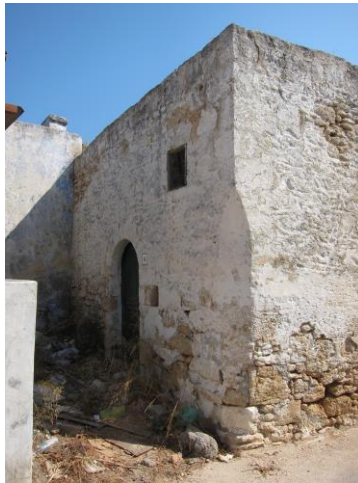
Εικόνα 19. Κτίσμα στον παλαιό πυρήνα του Παραδεισίου.