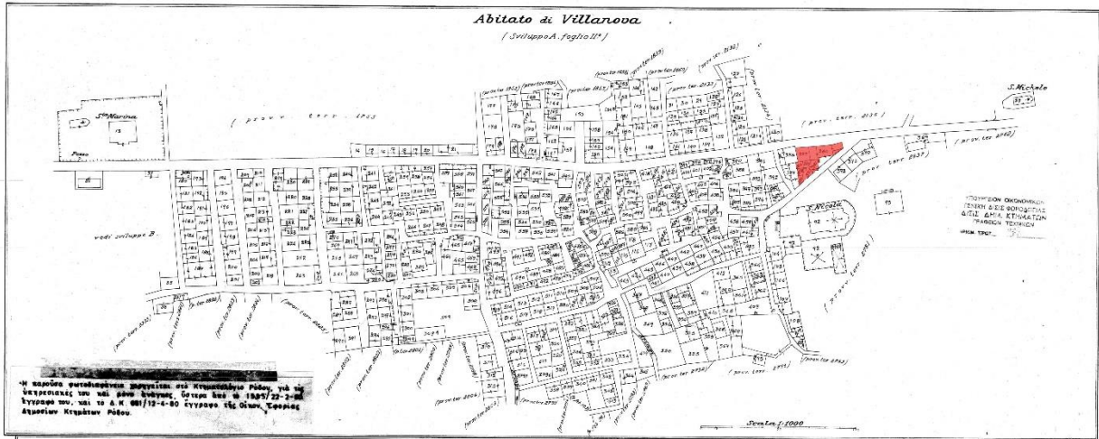
Εικόνα 7. Ο οικισμός του Παραδεισίου σε διάγραμμα ιταλικού κτηματολογίου. Με κόκκινο σημειώνονται τα προς κατεδάφιση κτήρια.