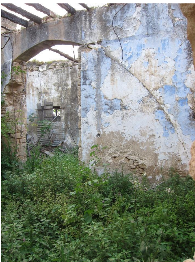
Εικόνα 6. Άποψη οξυκόρυφου τόξου στο εσωτερικό κτίσματος προς κατεδάφιση.