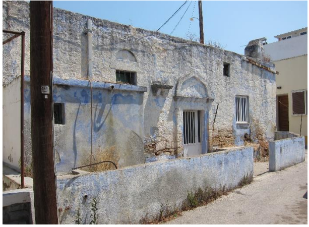
Εικόνα 15. Κτίσμα στον παλαιό πυρήνα του Παραδεισίου.