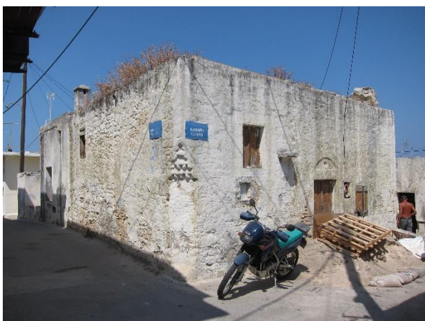
Εικόνα 12. Κτίσμα στον παλαιό πυρήνα του Παραδεισίου.