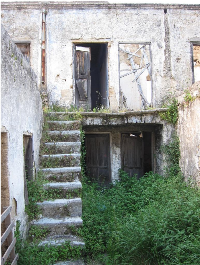
Εικόνα 4. Κτίσματα προς κατεδάφιση απέναντι από την εκκλησία του Αγ. Νικολάου.