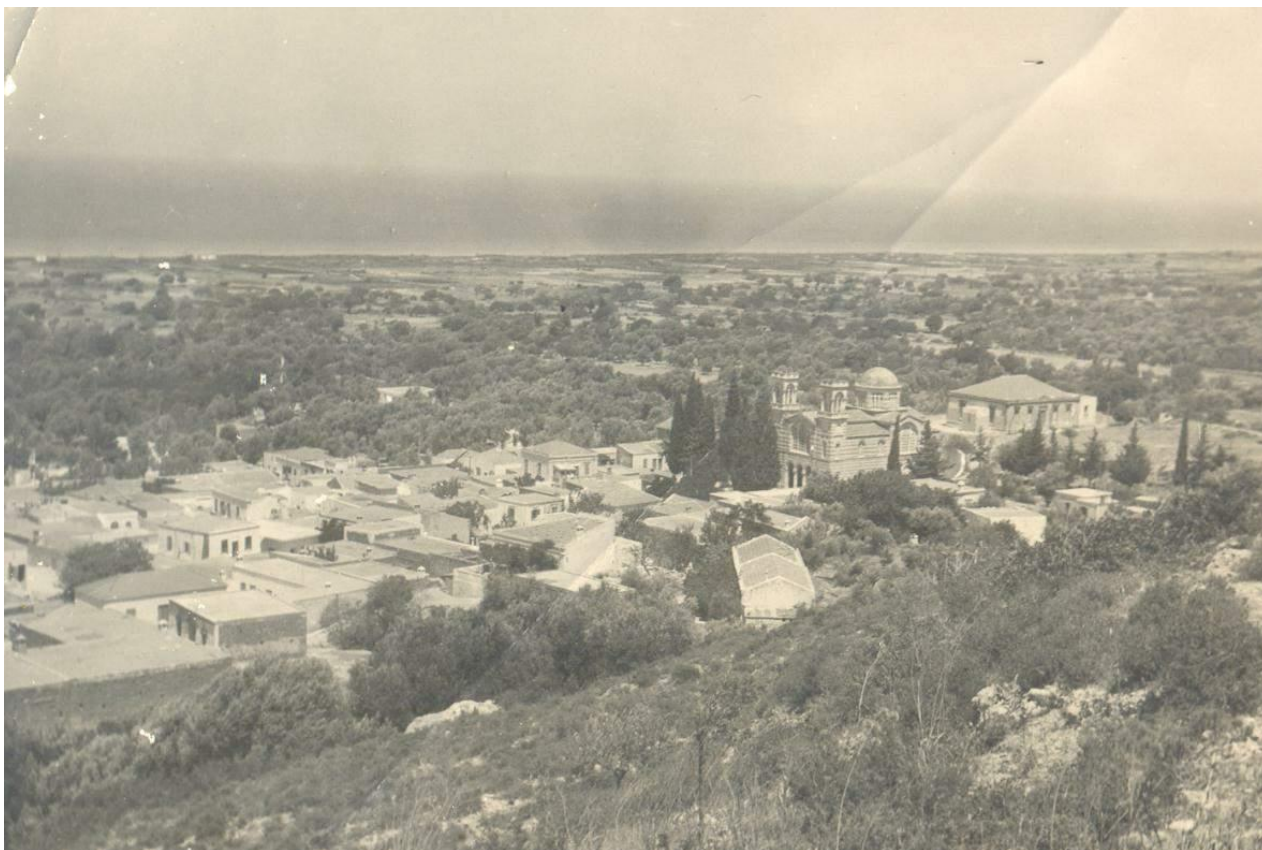
Εικόνα 11. Άποψη του οικισμού του Παραδεισίου και της πεδιάδας στην βόρεια πλευρά, στην οποία κατασκευάστηκε ο διεθνής αερολιμένας Ρόδου.