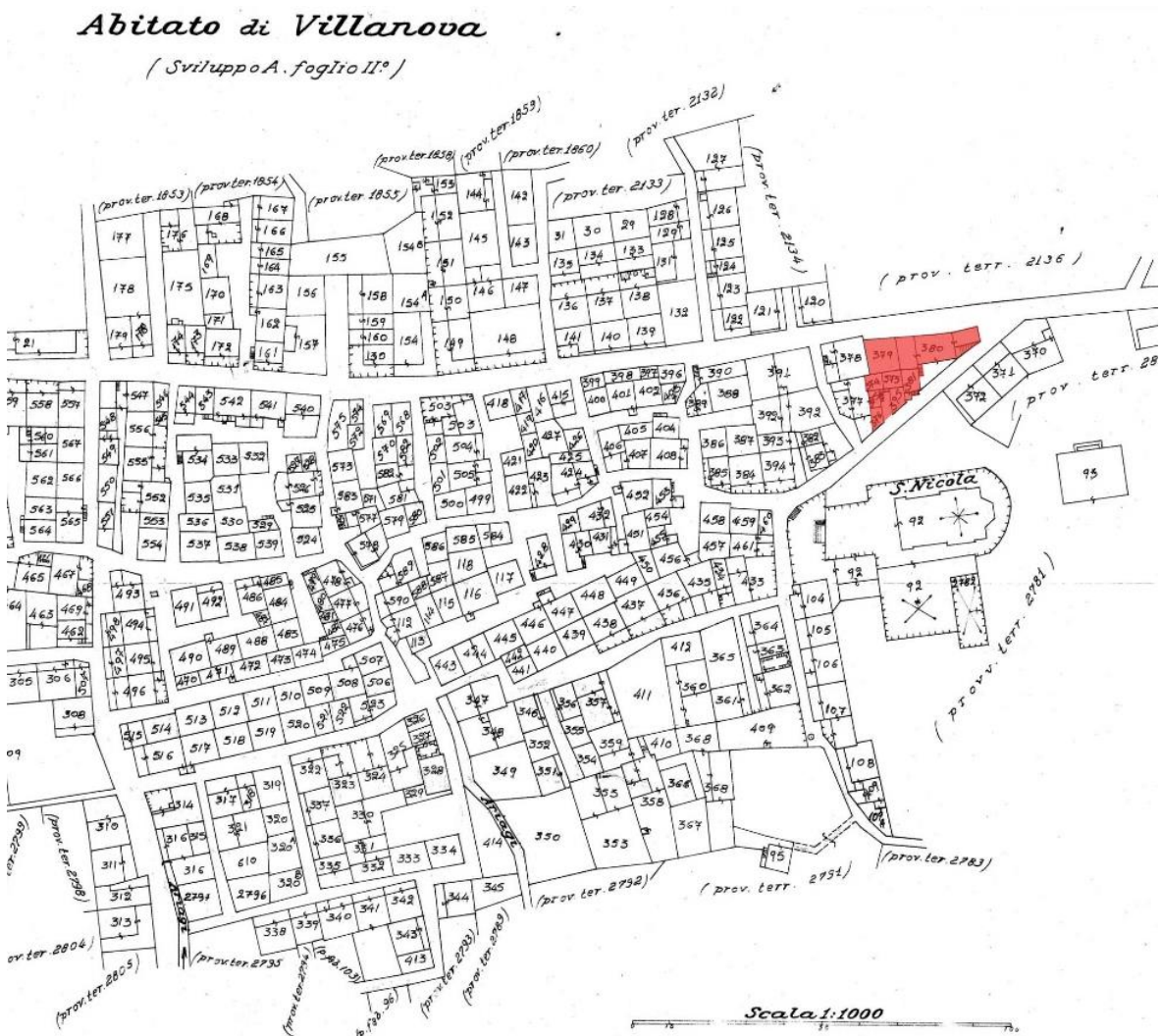
Εικόνα 8. Ο παλιός οικιστικός πυρήνας του 19ου αιώνα του οικισμού του Παραδεισίου σε διάγραμμα του ιταλικού κτηματολογίου. Με κόκκινο σημειώνονται τα προς κατεδάφιση κτήρια (λεπτομέρεια).