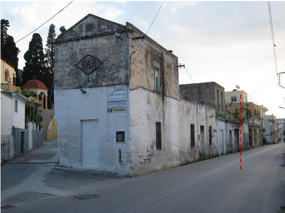
Εικόνα 1. Το προς κατεδάφιση οικοδομικό τετράγωνο στην είσοδο του οικισμού, όπως προσεγγίζεται από τον κύριο οδικό άξονα Ρόδου-Παραδεισίου. Αποψη από τα ανατολικά. Με κόκκινη γραμμή σημειώνεται το όριο της προτεινόμενης κατεδάφισης. Στο βάθος αριστερά η εκκλησία του Αγ. Νικολάου.