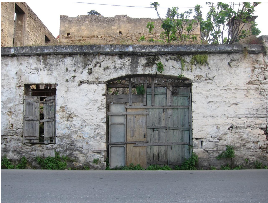
Εικόνα 5. Ο προς κατεδάφιση λαδόμυλος του Παπαλουκά επί του κεντρικού οδικού άξονα. Πίσω και αριστερά διακρίνονται τα επίσης προς κατεδάφιση διώροφα κτίσματα.