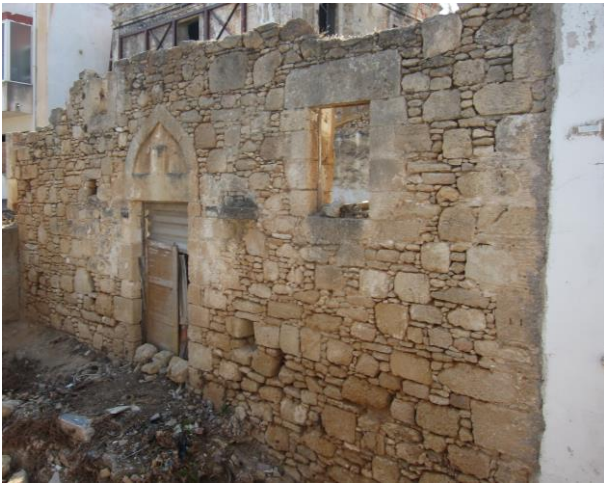
Εικόνα 18. Κτίσμα στον παλαιό πυρήνα του Παραδεισίου.